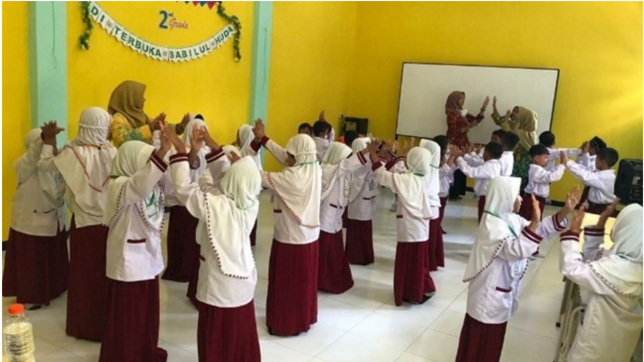
Figure 1. Penerapan Ice Breaking

Adapun beberapa hal yang perlu diperhatikan saat penerapan Ice Breaking dalam proses pembelajaran yaitu: Pertama , tidak terlalu lama dalam pelaksanaannya. Pada umumnya satu Ice Breaking dalam proses pembelajaran membutuhkan durasi 3 hingga 5 menit. Kedua , Ice Breaking diawali dengan intruksi yang benar dan jelas. tersebut . Ketiga , kegiatan ini hendaknya dilakukan dengan penuh antusias dan kegembiraan. Dua syarat ini penting agar Ice Breaking dapat berjalan lancar sesuai tujuan. Keempat , hal yang tak kalah penting sebelum melakukan permainan ini kepada peserta didik, seorang guru hendaknya sudah mencoba atau mempraktekkan Ice Breaking tersebut sebelum diterapkan ke peserta didik di dalam kelas [27].