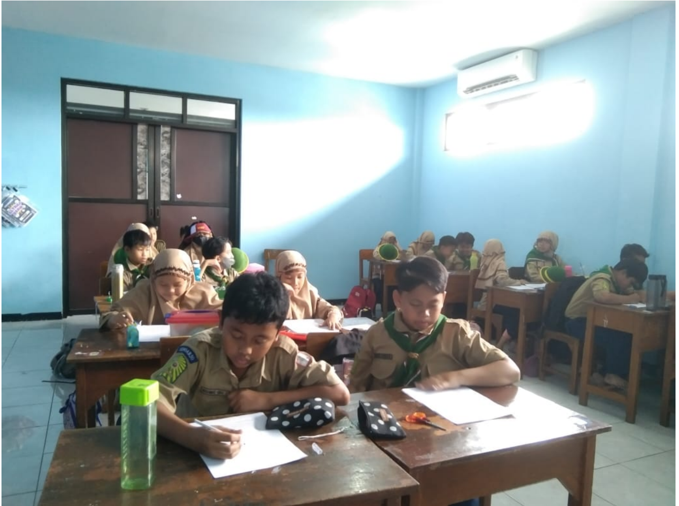
Gambar 2 (Siswa mengerjakan tugas yang diberikan oleh guru)

Selain itu, dokumentasi dari hasil observasi menunjukkan bahwa siswa yang telah menerima pembinaan tanggung jawab dari guru Akidah Akhlak cenderung memiliki tingkat kedisiplinan yang lebih tinggi dibandingkan dengan siswa yang kurang terlibat dalam kegiatan pembelajaran. Sikap tanggung jawab ini juga tercermin dalam partisipasi mereka dalam kegiatan ekstrakurikuler dan kepedulian terhadap lingkungan sekolah, seperti menjaga kebersihan kelas dan membantu teman yang kesulitan.