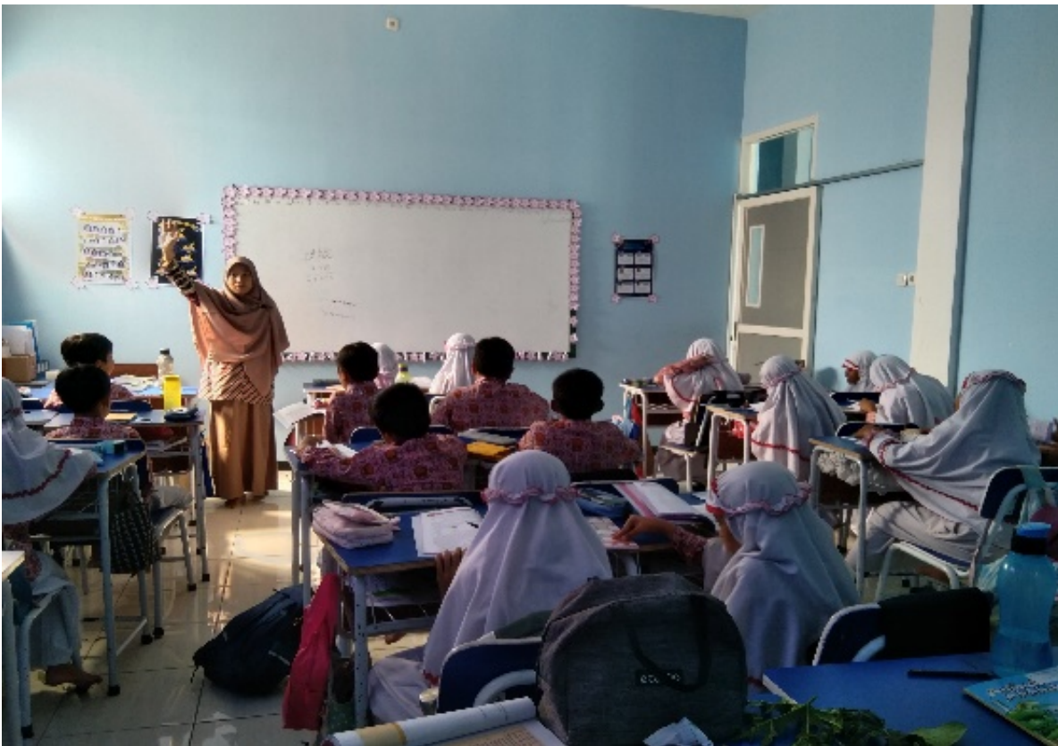
Gambar 1 (Guru Menggunakan Metode Ceramah)

Selain itu, dokumentasi dari hasil observasi menunjukkan bahwa siswa yang aktif dalam mengikuti pelajaran Akidah Akhlak